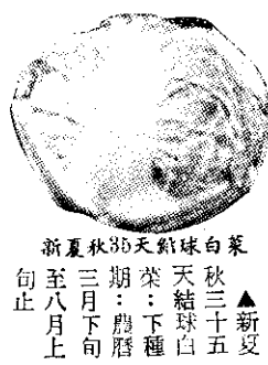
▲新夏 粉莖結球白菜：下種期：農曆二月下旬至七月上旬止 ▲秋三五 天結球白菜：下種期：農曆二月下旬至七月上旬止 ▲早生三十天青 粉莖結球白菜：下種期：農曆二月下旬至七月上旬止

▲農友們的大福音：在春夏秋季可以下種栽培各種品種：由二代七十餘年之經驗蔬菜種子專家，環球唯一有名清河種子行的最新改良各種優良品種供應國內外農友們安心栽培希請勿失良機敬請歡迎選購俾利收益。 ▲55天純白結晶花椰菜，下種期五月至七月。 ▲60日長(短)葉純白結晶花椰菜，下種期六月至九月末止。 ▲早中生55天黑紫結球白菜，下種期七月上旬至九月末。