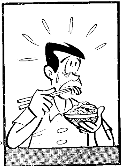
食 其 門 吃 保 管 充 好 注 意 在 著 滋 愛 天 氣 好 時 味 氣