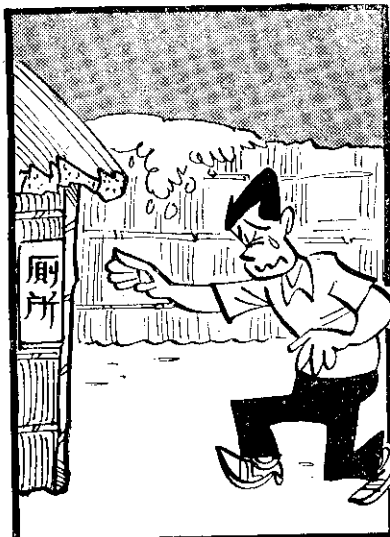
勉 以 入 所 給 了 肚 去 吃 後 仔 痛 去 伊 不 強 四 落 多 要 次 去 落 多 要 次