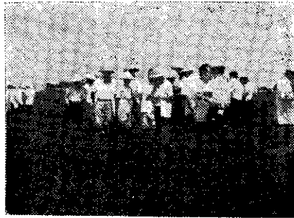
龜山會友觀摩茶園