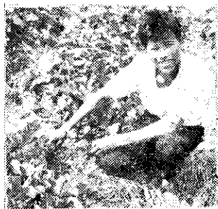
號游山宮) 友農山游 收提 (一) 里美溪桃 二華鎮大園 之一

待瓜收起，把瓜蔓捲成一束束，然後培土做成諸畦，另外預留一些空地，播種大心芥菜，育苗待移。因為五十七號甘藷成熟很早，如管理得好