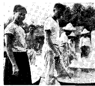
吉田加工製造醬油

大豆耕種技術等，由高雄區農業改良場派員擔任講師，會後並往該鎮埤頂里參觀水稻生產技術綜合示範田栽培。(秋)