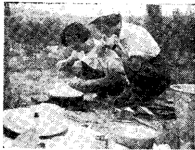
崙背會員表演家事

臺南區農業改良場舉辦的水稻生產技術綜合示範田觀摩研究會，於十月十三日在臺南縣政府大禮堂舉行。該項觀摩研究會，參加者計有嘉義、雲林、臺南等縣市各鄉鎮農業技術人員二百餘人