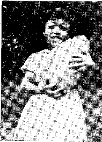
一個大木瓜重達十壹斤。這個大木瓜是十月二十三

色（粉質）蕃薯洗淨削皮，切成手指粗條，另約半斤菜豆洗淨擊斷約寸半長，並切十來片豬肉及少許蝦米待用。 鍋熱後，放入二匙花生油（或豬油）等油大熱，將肉片及蝦米倒入爆