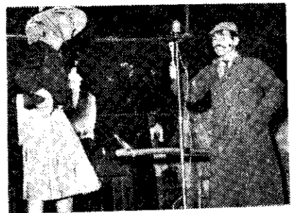
松山區演老漢選妻

在辦理共同栽培的過程中，雖然有某些困難發生，但我們終能予以克服，因此自實施共同栽培以來，單位面積的生產量已有顯著的增加。比一般栽培區多收四千元。