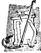
消毒舊菇舍可使用福爾馬林過錳酸鉀

【問】：(一)葛藤採織要點：(1)需採取當年生幼蔓每隔三十至五十天採割一次。(2)鮮蔓置大鍋沸水中煮，或利用蒸香茅之蒸鍋蒸汽煮，時間約二十至四十分鐘，視蔓之老幼而定。(3)將水或米湯水中經四小時。(4)曬乾。纖維長度須保持四至五公尺，打細後置乾燥處收藏。又本刊以後將介紹有關葛藤栽培採織等方法，到時請參考。(賴裕立)