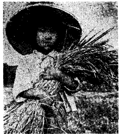
施用硫酸鎂可增產一至二成