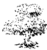
「十姐妹」鳥唇鳥 雌雄鑑別法

〔首〕先掘一直徑約二呎的播種穴。用堆肥混合好土壤填充穴內。然後將椰子果實平臥放入，果實的頂上部約與地面齊平。覆土的高度也以此為標準。然後在它的週圍用土培高，作成盆形，以便灌水。上面並需加蓋草類，經常維持溼潤便可。(張振甫)