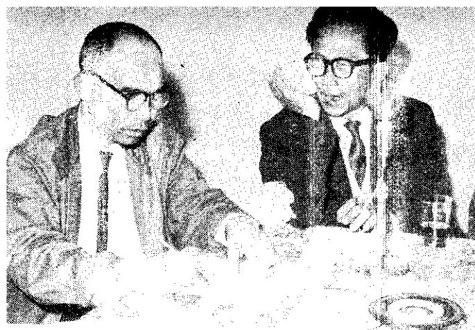
望布有眼也眼龍枝荔：說(右)友農圃石川

原因似與砧木有關。目前我們使用的砧木多為柚子，如果設法改善砧木，則將可以生產品質良好的檸檬。 這位對果樹研究頗有造詣的黃教授指出，改良砧木，除了我們可以試用酸桔外，在美國盛產檸檬的「加里佛尼亞州」，他們使用的砧木為「酸橙」，這種酸橙很像臺灣的「虎頭柑」，我們也希望將「虎頭柑」試試，使生產薄皮，果汁多，味不苦的檸檬出來。