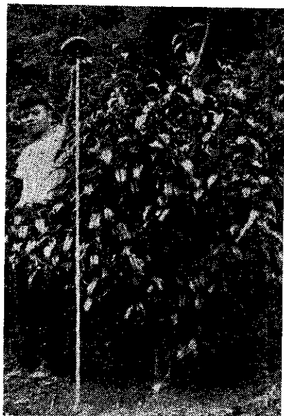
八一一五茶姆薩阿技培 。形情長生後年一種品

採用型性優良親本，進行人工交配，培育雜種第一代，並利用雜種優勢選育新品種，自民國三十五年開始進行，雜交後代合計已有一千九百七十四系統，分別進行單株特性調查，株行試驗及高級試驗等工作，其中 F. K. K. 一號香氣特優，味道雋永，品質極佳。其特徵如次頁表二所示。