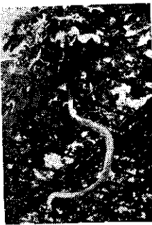
在葡萄架上生長中的蛇瓜

蛇瓜的種子和苦瓜類同，內有廿五至卅粒，它的味道和刺瓜差不多。蛇瓜生長特別快，每天可長三寸半，到成熟時，可長達五至七尺，瓜徑一寸半至二寸半，是臺灣很少見到的瓜類。