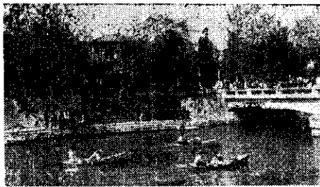
船賽橋柳在，友會心埔化彰

備停當，槍聲破空傳來，選手們破浪前進，技術高超的二號船，如箭似的直駛而去；有如蜿蜒的水蛇般划行的三號船，似乎不聽指揮，東擺西歪；四號船更妙，開頭竟像打陀螺似地逗圈兒不走；一號船最穩，不慌不忙，一波一波地前進，有如老人漫步於晨光下的道路之上。