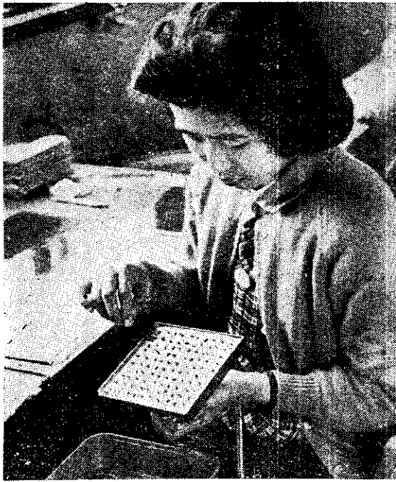
(攝採國飽) 驗試芽發理辦室查檢子種廳農林

檢查室是一座龐大紅磚建築物，佔地約三百八十四平方公尺，內部分開為會議、標本兼辦公室、