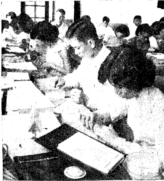
遠東種子技術人員訓練班學員實習情形

復會、農林廳和臺灣大學協助。各學員對種子檢查和室內各種儀器設備等使用方法，都有非常濃厚的興趣，獲益很多，是一次對國外人員非常成功的訓練班。在國內訓練方面，於五十二年三月和六、七月間，分別舉辦三次檢驗局和糧食局種子檢查技術人員講習班，由農復會、農林廳和糧食局合辦，藉此提高本省種子工作同仁的學識和技能，所以該室是一個訓練國內外種子工作人員的理想場所。