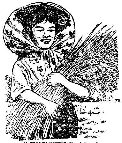
施用硫酸鎂可增產一至二成