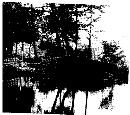
← 阿里山名勝姊妹潭。