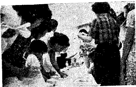
埔里家政鑑別會場

粽子……中的餛飩及豆腐湯；冷飲則光顧枸杞冰、冷凍鳳梨酥、蛋酥等美食。暗自忖度，等會兒看看走得動嗎？幸虧胃部幫忙不然可慘了。中午到綜合大樓逛一圈，又繞回學校參觀下午二時時裝表演的盛會。好在票預先弄妥，光排隊劃票就使你好受。下了一場雨，地上頗不好走，好在進到禮堂一切不管。因為時裝包括有居家服、兒童服、運動服、外出服、訪問服、赴會服、大禮服……等十三項，一百六十餘人參演出，猶如中國小姐競賽，令參觀者大呼過癮不已。綜合一天的過程，不但學到了許多作業的新常識，也得到不少人生的道理。