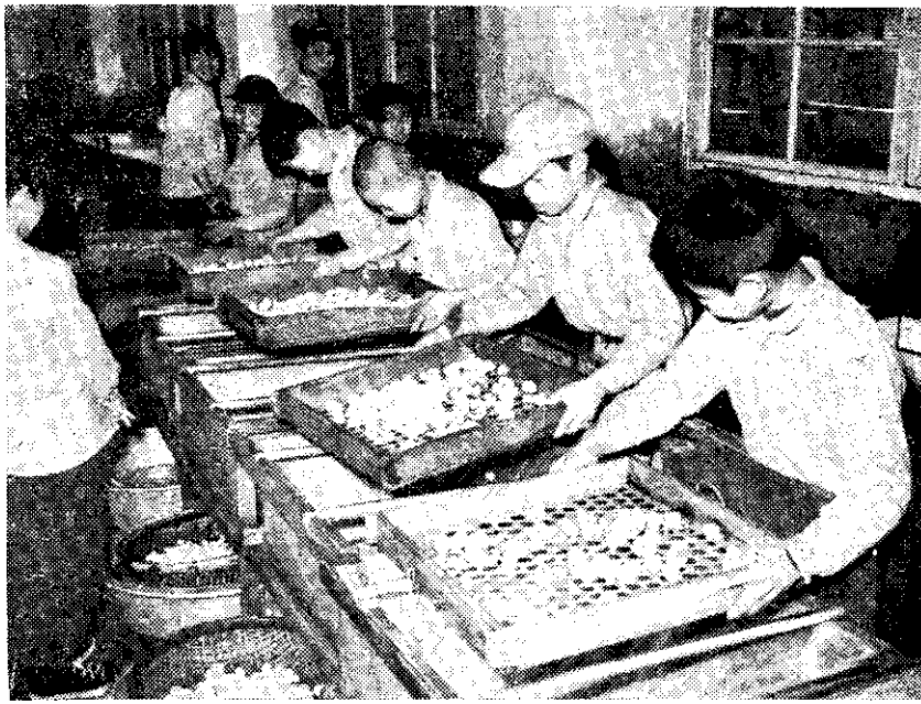
(攝珠國純) 形情級分前工加菇洋

市場，它就不值錢。因此，希望大家把眼光放大大一點，今天我們要爭取的是客戶的訂單，消費者的批評，從訂單的條件和批評的結論，來研究如何提高臺灣洋菇的品質，增進臺灣洋菇的風味，來迎合消費者的需要，這才是我們要集中力量用心來檢討的問題，所以今天我願意再重復一次提出這幾個老問題，來請大家研究改進。