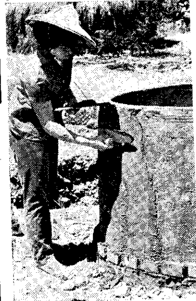
● 片 ● 照 明 ● 說 ● (上) 用石頭砌造青貯窖情形 (中) 用磚砌造後內外抹水泥 (下) 做好青貯料後覆蓋防雨