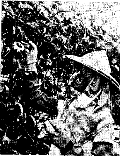
百香果人工授粉情形

據說在開花盛期，每一女工一分鐘裏平均可授粉十朵花，每小時可授粉六百朵，每日工作五小時，可授粉三千朵，左圖示一位女工正用平頭毛筆授粉情形。（陳孟猶）