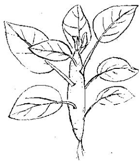
藍芥花白的栽培播道