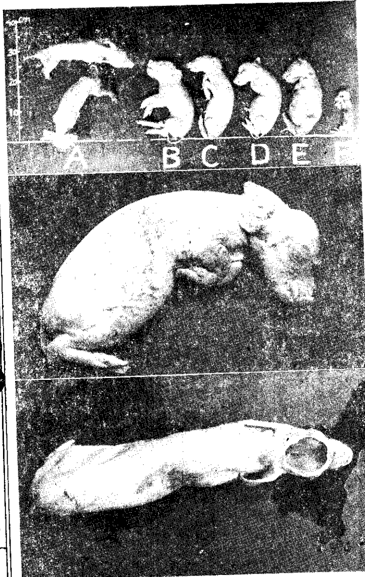
。猪仔死的產生而炎腦患：一圖 。起隆蓋頭、腫水：二圖 。液體滿充腔內：三圖

臺灣總代理 日星實業股份有限公司 電話：40550 40660 • 47374 臺北市南京西路五號之一