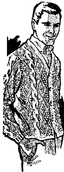
尖領對襟五粒鈕扣毛線衣，包括幾種不同形狀的線形和圖案，表現出旺盛精神與健壯的體格。(未)

婚禮應以簡單隆重為上，不必過份鋪張。超過範圍的大宴賓客，對於主客雙方，都是吃力不討好的事。吃喝之後大鬧洞房，既不成體統，又徒然增加新人的不安。(樂樂)