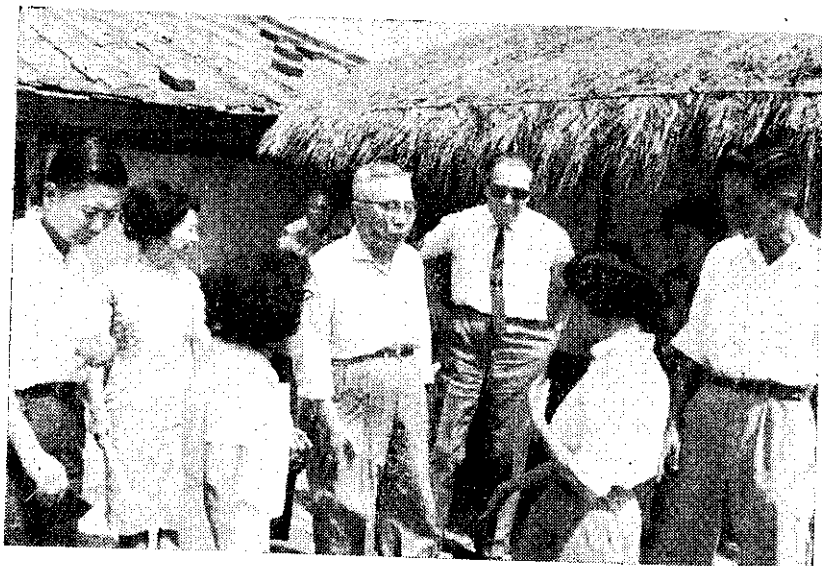
(攝環國純)。村農問訪(右中)曼夫郝員委籍美與(左中)瀚宗沈員委任主會復農

美國瓊胺公司現已發明一種專治鈎蟲病的藥物，對於四大類鈎蟲的成蟲，具有百分之百的驅除效率，此種新藥學名 Diognol，商標名稱為安狗樂。每頭注射一次，四大類鈎蟲的成蟲即告絕跡，無需再次注射或服用其他藥物，亦未發現任何不良反應。對人類健康可稱是一大保障。