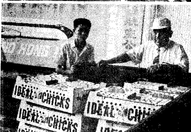
台南種雞場的鷄舍(上)和由美國引進愛麗兒蛋鷄情形

生產較大的卵，在產蛋開始一年間，大卵的比率佔七五%以上。③愛麗兒產蛋在飼養時只要衛生環境良好，妥善預防傳染病，自產蛋開始一年間，其生存率可達九十一·九五%。④鷄的體格大小與飼料利用效率有密切的關係，愛麗兒蛋產力充分的探蛋鷄中，其體重也不過四·三至四·五磅(約二公斤)而已，在高產蛋能力的探蛋鷄中，是體形最小，體重最輕的鷄隻。⑤飼料利用效率高，愛麗兒蛋每產一打(十二粒)蛋所需要的飼料是四·一磅(約一·八公斤)。⑥在肉鷄方面「加利昇」肉鷄也很不錯，公雞週齡時可達一公斤半，飼料利用效率是二·一三。