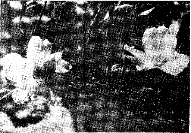
白大③，雲白②，梅瓣雙①：起上從，種品梅茶