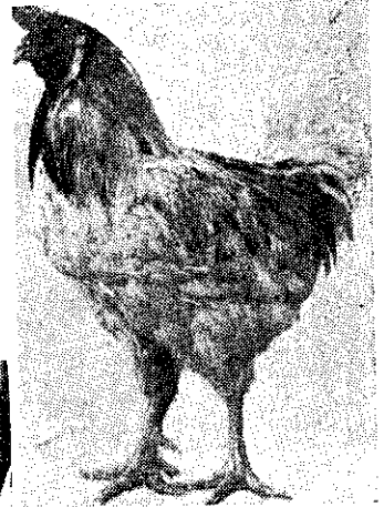
華美種鷄場所供應金馬肉鷄K四四公(左)母(下)