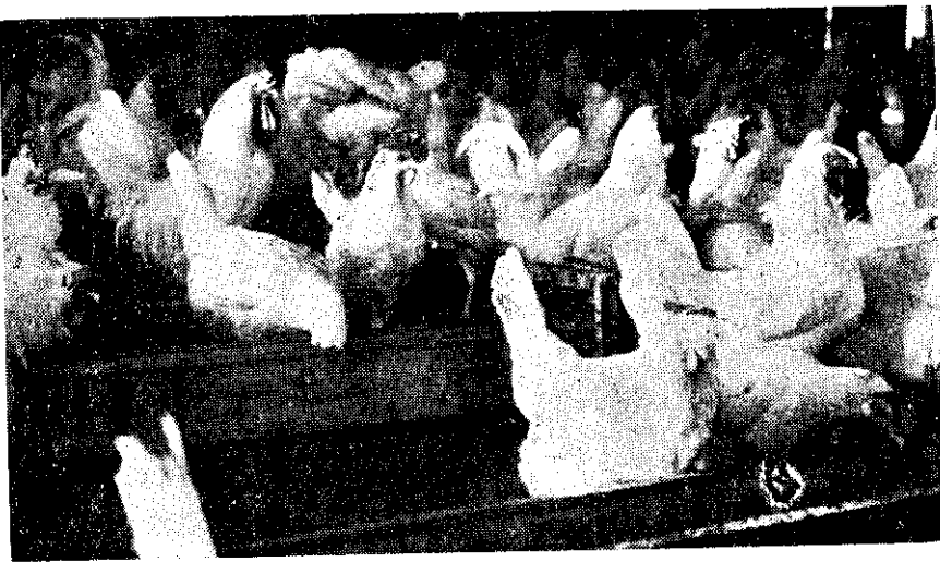
形情飼平七三一K鷄蛋馬金

行的任意抽樣檢定，該場鷄種均名列前茅，並獲收益最多，鮮蛋銷售量最高的榮譽。 華 美種鷄場代理美國金馬農場育成的產卵鷄K一三七與K一五五，這兩種產卵鷄的主要特點是：對白血病呼吸器管病抵抗力強，死亡率低，省飼料，產卵多而大，經濟產卵期較一般鷄種長，蛋質優良而整齊，蛋黃大而重。肉鷄有金馬肉鷄K四四，是由K七〇一與K七四五育成，特點是飼料利用率高（二・二五—二・三〇），抗病力強，肉多味美，快大快吧，據說養七十天體重可達三臺斤，對一般家庭養肉鷄者頗爲適合，很受家庭養鷄戶的歡迎。 目 前該場飼養金馬產卵鷄與金馬肉鷄近萬隻，分飼於一、二樓鷄舍，每週孵出雛鷄萬餘隻。陳場主特別歡迎本刊讀者前往參觀指教。