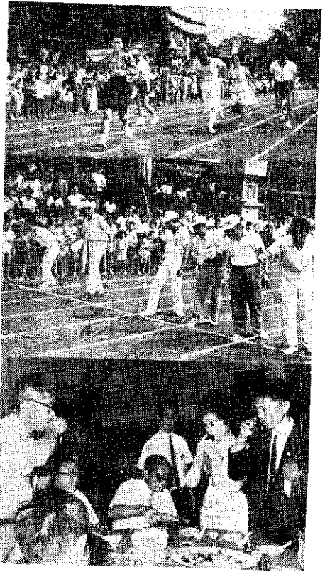
上：接刀比賽 中：釣魚比賽(黃藍)

該會會員為慶祝新郎新娘永結同心，特別選出代表前往祝賀，並由會員個別贈送禮物數十樣，以作紀念。(會員)