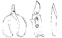
採果鉗 剪定鉗 接木刀