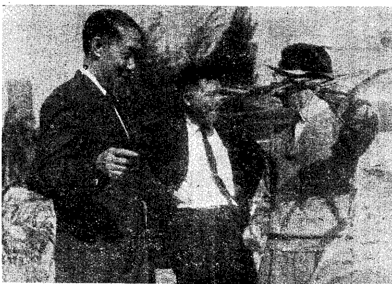
(攝忠學路)。作工種育心中米玉察視(左) 田研張長廳林農

雜作肥料 開始分配 今年第一期雜作肥料分配要點，業經臺灣省糧食局公佈實施，此項配肥範圍共有十九項