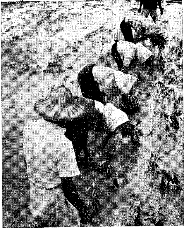
黃麻插頭苗打插紫蘆

用堆肥一萬六千至二萬公斤，作為基肥，硫酸銨四百至六百公斤或尿素二百至三百公斤，過磷酸鈣一百一十至二百二十公斤，氯化鉀一百六十至二百四十公斤作為追肥，分三次施用；第一次於播種後二至三星期，在行側開淺溝施入並覆土，以免肥料流失；第二次在播種後四至五星期，施用於另一行側後，兼行培土，土高約十至十五公分；第三次在七至八星期施用。 (4) 適當栽培密度：以行距四十五至五十公分，開播種溝條播，每公頃