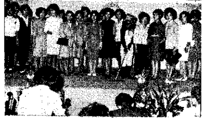
雲林康樂表演：上：素顏小姐要出嫁，中：賞月舞，下：服裝表演(順正)