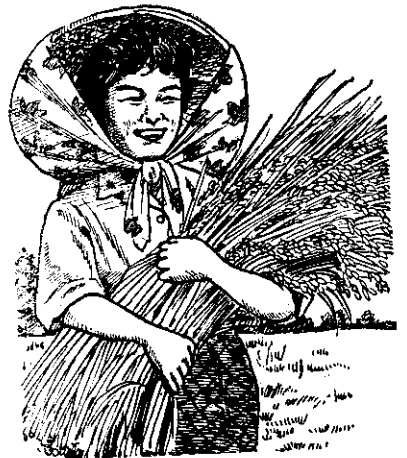
施用硫酸鎂可增產一至二成以上