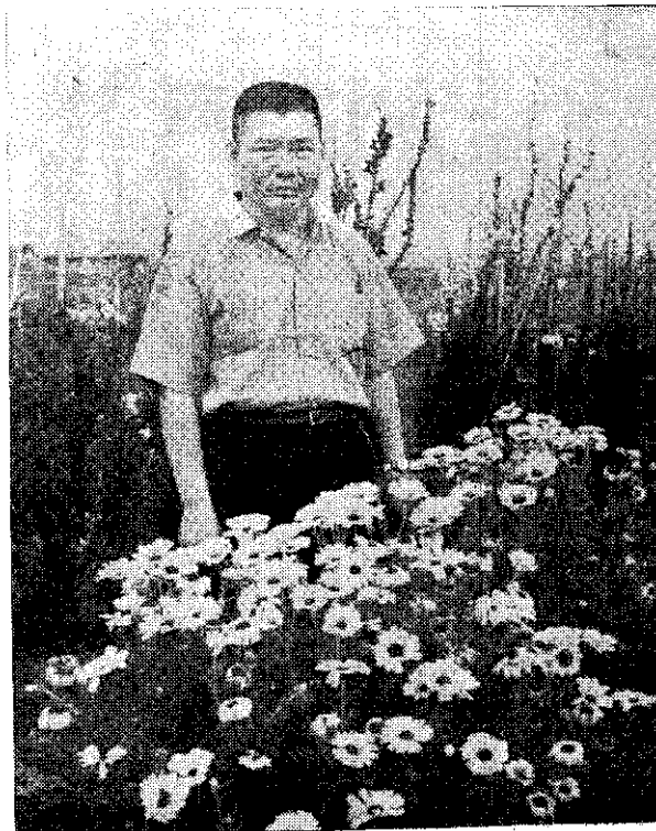
生先社昌彭者作文本