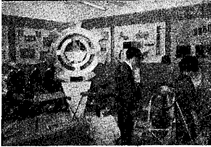
臺南縣教育展覽會場一隅：上：手工藝室，中：園藝室，下：農機室(唐少鏡)