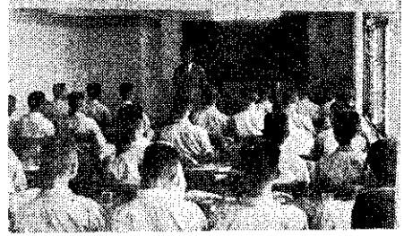
以上：赴非農耕隊之高中友和校在 師代表合影(中)。(湖中) 下：農中學生參觀農工廠聽講(王治)