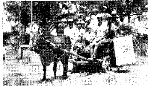
(秋)。草稗拔友農助員會安永