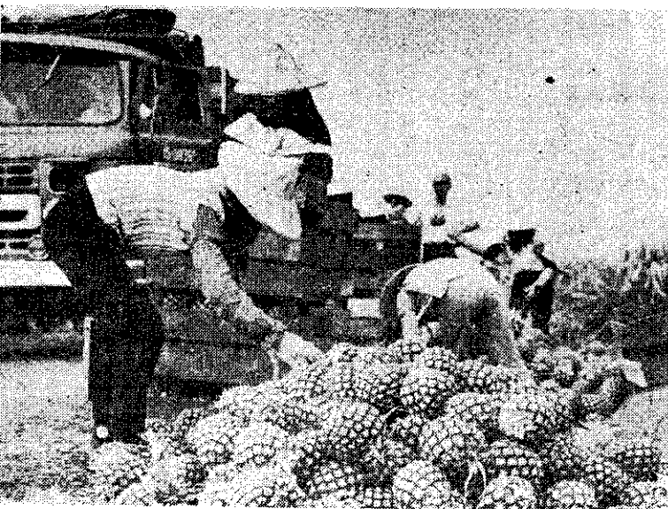
可供外銷的鳳梨生果

復會漁業的尾七元，降為最近的每尾二角。所以希望漁民盡量擴大繁殖事業。該專家說：每甲魚池的放入魚苗數，不妨可增加到二、三千尾。其他鱸、鯉、鯽魚等魚苗的情形，也是大量生產。因此，目前正是養魚的最好時機。