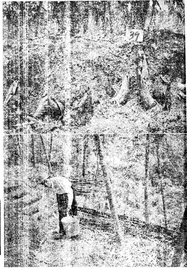
(攝瑞張) 圖竹蔴的管經約集

南投縣蔴竹栽培面積約八千一百二十公頃，過去除草屯、埔里一部份採用集約採栽培生筍（或稱爲菜筍）罐頭筍外，其餘地區均是粗放經營，以留竹材及採筍乾任其生產。近年來承農復會及縣政府極力推行後，其他地區亦漸改爲集約栽培以採生筍，或罐頭筍今年已在本縣各鄉鎮設立十處集約栽培示範區。茲介紹本縣二處不同條件栽培方法供爲參考。