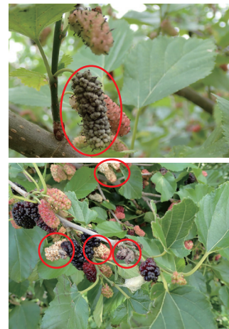
圖二、遭桑椹菌核病感染形成灰白色的果實 ( 紅圈 ) 在結果枝分布情形。