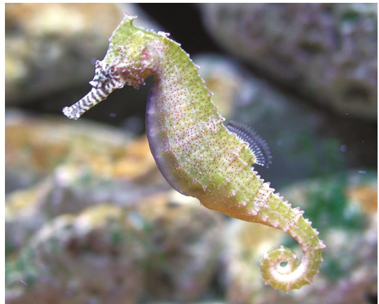
圖 8 鮑氏海馬的嘴部有斑馬紋

海馬體色雖然多變，但其斑紋所呈現的形狀卻不會改變，但有時會因為體色較深而不易觀察到。例如：鮑氏海馬的嘴部有斑馬紋（圖 8），三斑海馬在背部的第 1、第 4、第 7 個軀幹環上有三個深色的斑點，胸腹部斑紋成橫向的條紋斑紋（圖 9），棘海馬則有縱向的蛇紋斑紋（圖 10），虎尾海馬呈現環狀與塊狀斑紋，一般以黃色與深褐色環塊斑紋相間，像似老虎的尾巴（圖 11），庫達海馬則具圓點狀斑紋（圖 12）。