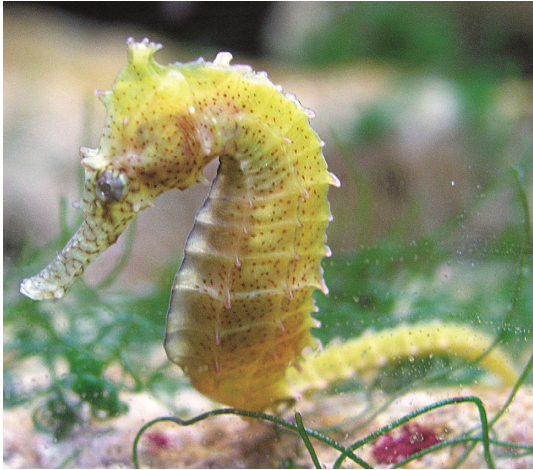
圖 5 鮑氏海馬頭冠特別高