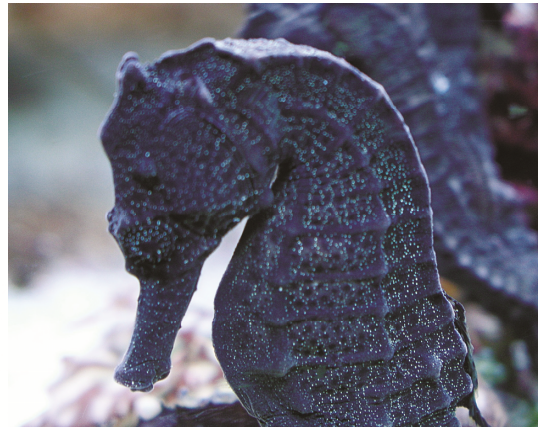
圖 3 庫達海馬表面光滑無棘刺

有些海馬在體表的骨環連接處會突出，而形成棘或刺，棘與刺的有無與長短也是分類上的重要依據。像庫達海馬的骨環連接處平整無棘刺 (圖 3)，三斑海馬鰓蓋下緣有倒勾的棘刺且骨冠低矮 (圖 4)，鮑氏海馬頭冠棘特別高，體部棘刺也較長 (圖 5)，虎尾海馬頭骨冠低矮，體棘成小小突出的結瘤狀顆粒 (圖 6)，棘海馬的第 1、第 4、第 7 與第 11 個軀幹環上的棘通常較長 (圖 7)。