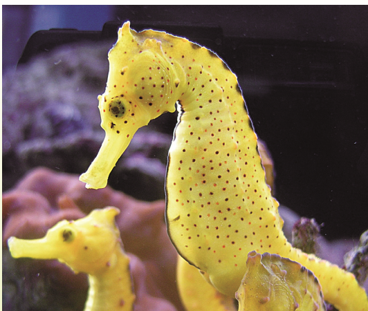
圖 12 庫達海馬則是圓點狀斑紋