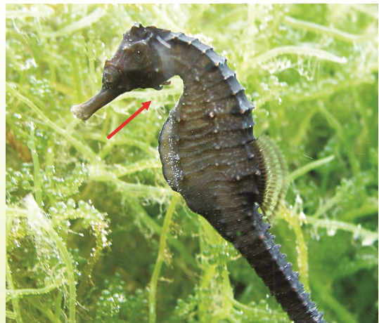
圖 4 三斑海馬鰓蓋下緣有倒勾