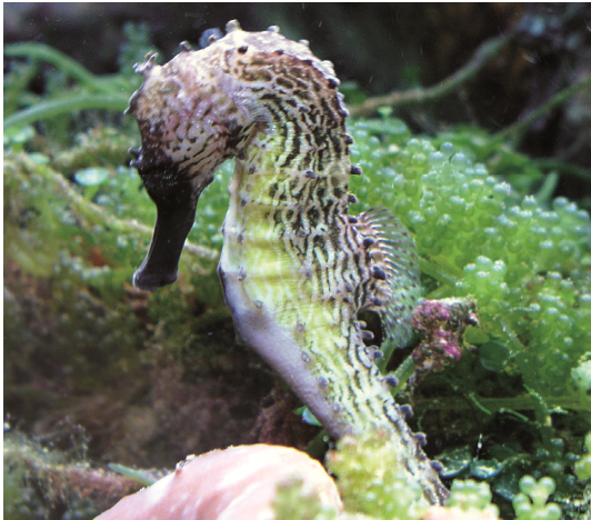
圖 10 棘海馬縱向的蛇紋斑紋