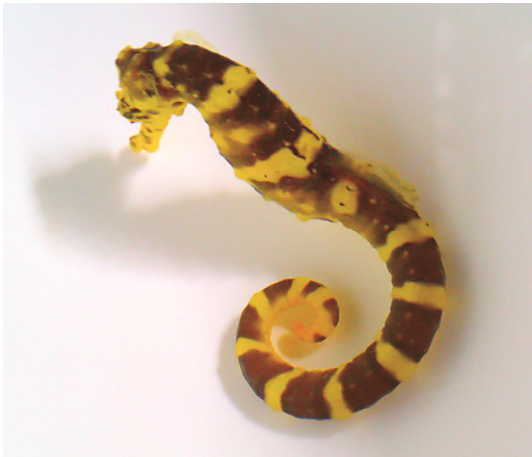
圖 11 虎尾海馬環狀與塊狀的斑紋