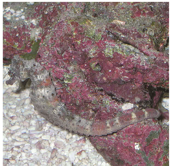
圖 13 海馬體色與背景融合

在自然海域環境中，有些海馬會從棘刺頂端長出角質層而擬態成海藻的型態，體色也會變成與環境背景相似的颜色 (圖 13)，加上海馬大多時間都勾在礁岩或海藻上，幾乎是靜止不動，使敵人不見察覺而避開危險，也使自己比較容易攝食到小型甲殼動物。