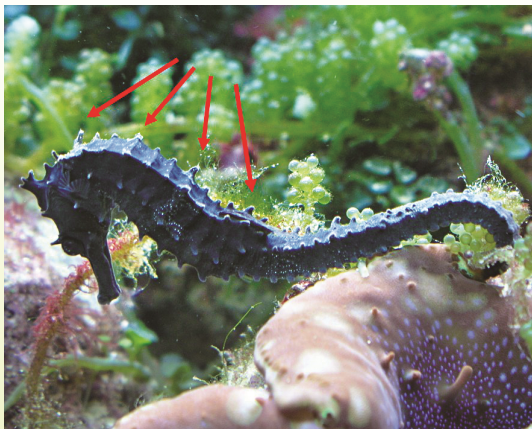
圖 7 棘海馬第 1、4、7、11 節體環的棘比較長