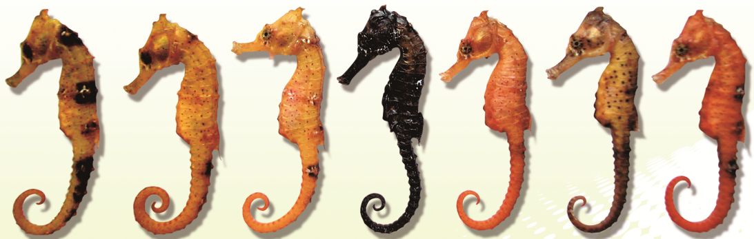
圖 1 具不同體色的庫達海馬

多樣的體色變化常會讓人誤以為是不同的品種，但事實上，即使是同一品種的海馬也常有不同的體色，例如庫達海馬 ( Hippocampus kuda ) 的主要色系就有黑色、紅色、橘色、褐色、深褐色等 (圖 1)，加上求偶時期體色也會產生變化，所以很難根據體色去辨別海馬的種類。