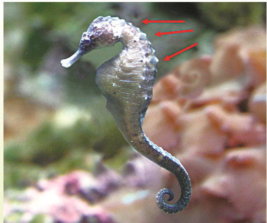
圖 9 三斑海馬的三個斑點與胸腹部橫向條紋