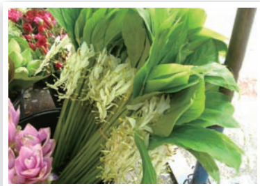
⑥ 圖6. 泰國市場上的舞花薑切花。