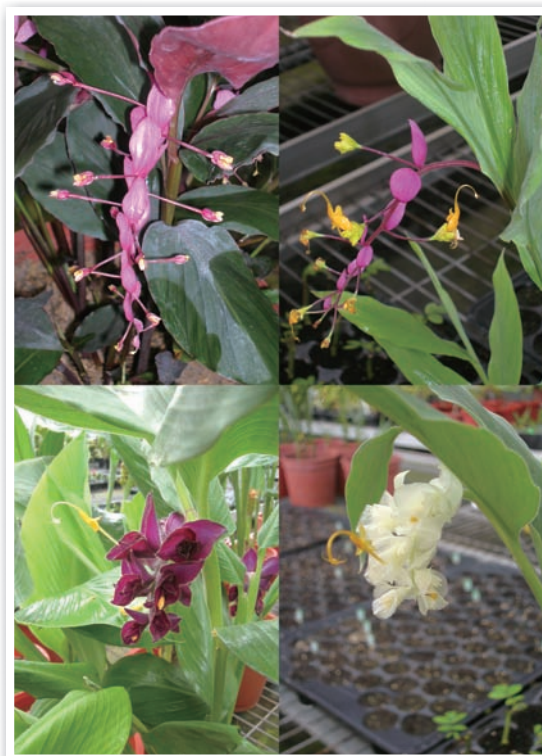
圖1. 幾種不同顏色的舞花薑品種。

舞花薑屬( Globba spp.)植物是薑科多年生宿根性草本植物，原產熱帶東南亞地區，分布北可達中國南部、西達澳洲，品種有100種以上。如同許多薑科花卉，色彩豔麗的苞片是舞花薑最主要的觀賞部位，依品種不同，苞片有紫色、紫紅、粉紅、白、鵝黃等色(圖1)，整齊排列成長串花序，自莖頂開出而呈下垂狀，也有部分品種花序是直立型。真正的小花會自每一片苞片中開出，相對而言花朵顯得極為嬌小，顏色多數呈黃色系的淺黃色至橙色，特殊的是它的形狀如同一位翩然起舞的舞者或是昂首站立的小鳥(圖2)，這也是本屬植物中文名稱的由來，臺灣常見的一個品種園藝業者就將它命名為「黃金鶴」(圖3)，花朵就像是一隻金黃色的鶴，細長彎曲的脖子其實是它的蕊柱，雄蕊與雌蕊就包含在其中。每一朵花只有一天的壽命，但不同的苞片每天會接續開出新的花朵，如同一隻隻黃色的鶴鳥在花序間跳躍，極富生趣！「黃金鶴」經由業者的大量繁殖，在盆花市場已頗為常見，另一個名為「紫薑」的深紫色苞片品種也開始在園藝店面露臉，藉由民間業者或趣味栽培者的引進，愈來愈多的舞花薑品種出現在臺灣的花卉市場。