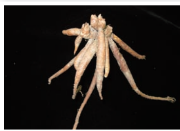
④ 圖4. 舞花薑球莖。

以目前在臺灣最常見的「黃金鶴」為例，在園藝店多以大約6寸盆的盆花型式販售，這個品種的葉形寬大、葉色濃綠，莖部與葉背呈紫紅色，即使在沒有花的時候也具有觀葉盆栽的觀賞價值；盆花型式的舞花薑整個夏季至秋季會不斷地生長與開花，觀賞期長而且照顧容易，是很好的觀賞盆栽；舞花薑要作為切花觀賞也很適合(圖5)，這類植物的莖部略帶有蠟質，切花可維持3至4週的觀賞期，有時候瓶插水中時在切口處會自行發根，移植至土中又可成為一株新的植株，繁殖力極強。在東南亞國家，部分品種株型較高大、切花枝較長，早已做為禮佛切花用途(圖6)，臺灣目前所引進的品種株型較矮，自地基部剪下開花枝長度約50公分，雖未如切花市場之等級，但居家種植自用即已足夠，也不需再做修剪；未來若能有更多的品種進入臺灣，在切花的利用上能有更多樣的選擇，舞花薑將成為夏季花卉市場的新星。