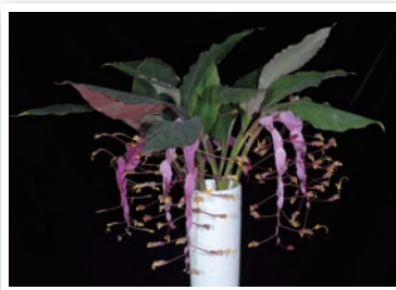
⑤ 圖5. 「黃金鶴」瓶插賞心悅目、觀賞期長。