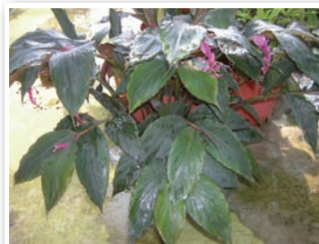
圖3. 常見的舞花薑品種—「黃金鶴」。