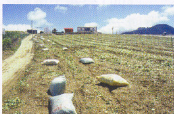
第二次整地作畦前，施用粗纖維及木質素有利甘藍苗生長