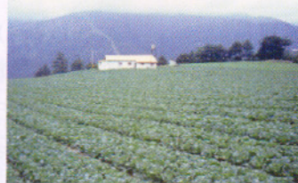
梨山地區甘藍菜園