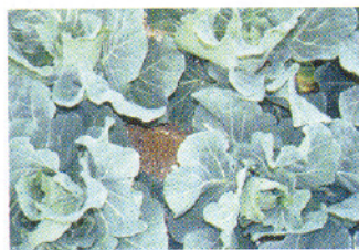
甘藍生長期施過量肥料會影響土壤及生態水質

農友施用有機肥時皆以成本較低的生雞糞為主，而未選擇發酵完全腐熟有機肥，由於生雞糞含有高氮量的養分及易分解的有機化合物，當與豆粕、蓖麻粕、棉籽粕等高氮量有機肥直接施用，因未經過發酵或發酵不完全，易致蚊蠅及地下害蟲滋生，危害環境衛生及作物生長。