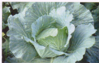
合理施肥甘藍初期結球生長

因此，建議農友施用腐熟完全富含有機成分及纖維質、木質素含量高的有機肥料，才能有效改良土壤肥力，增加土壤中有益微生物活性，分解礦化釋出養分，以提高肥料的肥效，促使甘藍作物充分吸收利用，提升甘藍產量及品質。