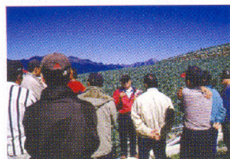
利用田間觀摩，講授正確施肥觀念