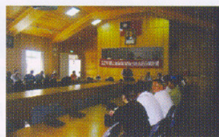
蔬菜園合理施肥管理座談會

現在依據 梨山地區甘藍菜園進行土壤肥力速測及農友施肥記錄，推荐合理化施肥及有機肥料使用量、以降低生產成本，改善環境品質。