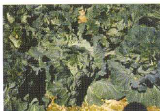
過度施用肥料使土壤鹽化嚴重

16.8% (273公斤/公頃)，磷肥減少19.8% (170公斤/公頃)，鉀肥減少14.8% (154