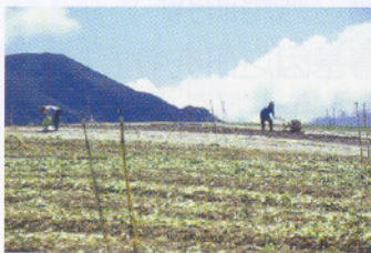
蔬菜園整地施用石灰資材，增加土壤鈣含量，減少根瘤病發生