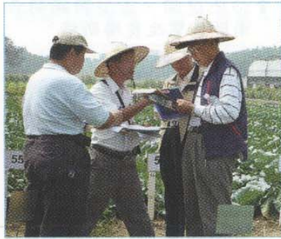
→評審委員們討論評分標準