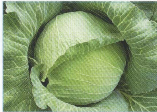
↑ 第二名「百樂」 ↑