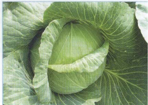
↑ 第二名「青翠」 ↑