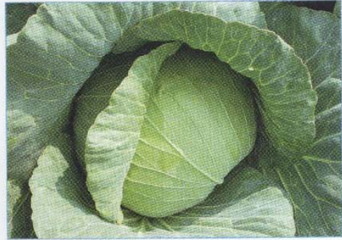
↑ 第三名 「No.525」 ↑