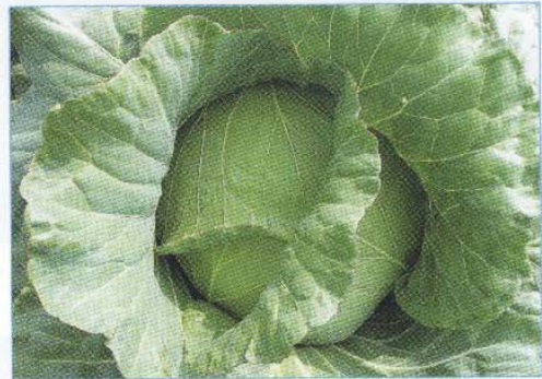
↑ 第三名 「秋王」 ↑