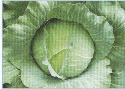
↑ 第一名「F-1259」 ↑