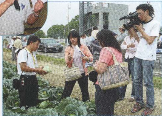
↑電視台也來採訪這個比賽活動