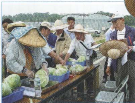
↑評審們試吃甘藍葉片