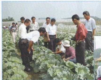
↑各家種苗公司人員觀察生長情形