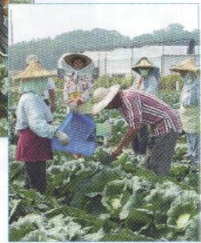
↑工作人員割取葉球評分