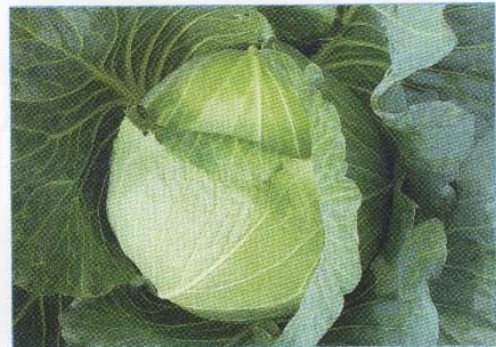
↑ 第三名 「No.411」 ↑