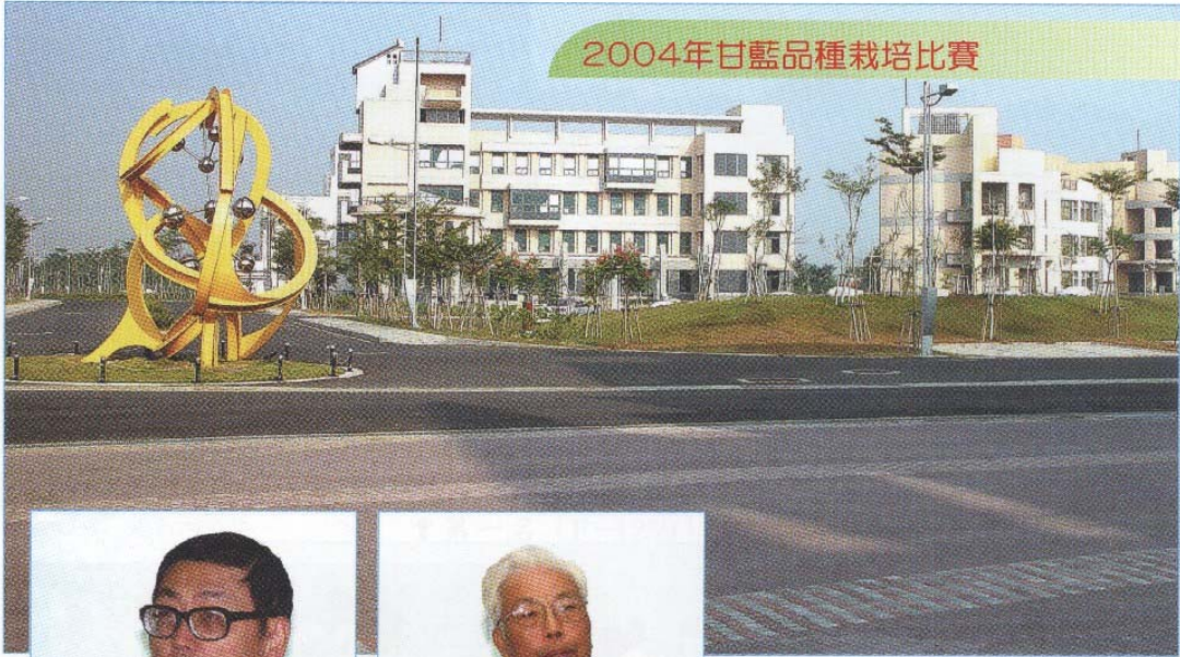
↑佔地遼闊、造型新穎的台南區農業改良場新場