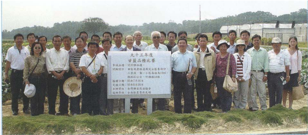
↑全體人員在田間合照