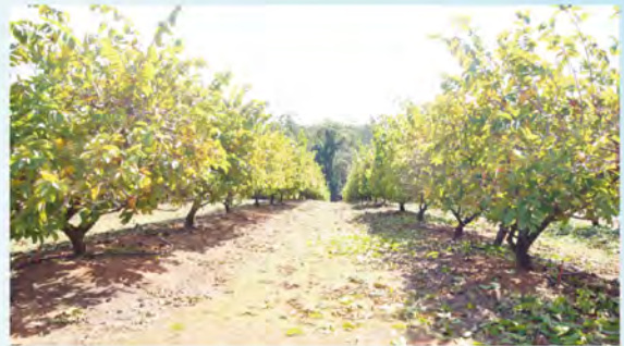
圖 2. 昆士蘭州陽光海岸 Glasshouse mountains 鳳梨釋迦栽培情形

澳大利亞鳳梨釋迦樹形從早期樹高 8-10 公尺，目前已利用修剪矮化至 3 公尺以下（圖 2），並搭配棚架設施進行密植管理，所以推薦種植行株距也從 8-10 公尺，縮短至 4-5 公尺，大幅提高種植株數。田間作業多採機械操作，果農購置大型農用機械並提供其他農場租借。樹形修剪先用機械修剪（圖 3），利用修剪機將樹形修出（圖 4），再輔以人工作業（除葉、短截修剪等）。工資每人每天工作 8 小時為 180 澳幣。因為澳大利亞工資非常高，多為學生臨時打工，田間操作亦採簡化作業，每次僱工僅做一項動作，如機械修剪完先請一批人（3-5 人），進行除葉動作（圖 5），2 周後再請一批進行樹冠內短截工作。