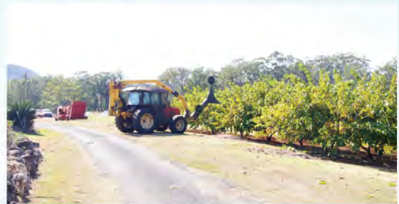
圖 3. 澳大利亞鳳梨釋迦果園利用修剪機進行修剪