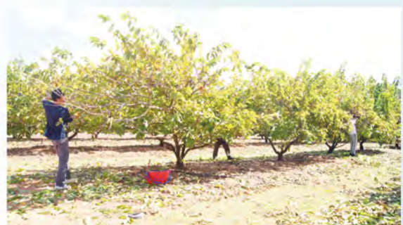
圖 5. 鳳梨釋迦機械修剪完後輔以人工除葉