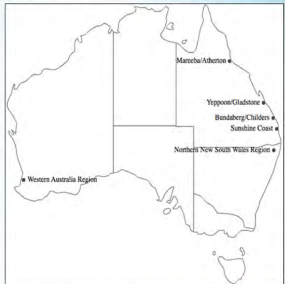
圖 1. 澳大利亞鳳梨釋迦種植區域。

鳳梨釋迦生產栽培模式於昆士蘭州為 7 月至 9 月進行修剪，10 月至翌年 1 月開花及著果，產期 2 月至 7 月。新南威爾斯州則為 11 月至翌年 1 月進行修剪，12 月至翌年 3 月開花及著果，產期 5 月至 10 月。澳大利亞鳳梨釋迦產業利