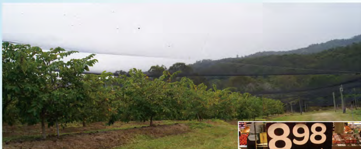
圖 6. 鳳梨釋迦園搭設黑網保護果實情形

澳大利亞鳳梨釋迦品種之開花習性與臺灣番荔枝略同，除了‘KJ Pinks’品種利用昆蟲授粉不需人工授粉外，其餘品種（‘African Pride’、‘Hillary White’等）生產仍需人工授粉。作業方式為上午採取瓣展期花朵，下午進行乾燥與花瓣處理，隔天早上蒐集花粉後，於 6 點至 11 點授粉。有 90% 使用授粉筆（brush）授粉，僅少部分使用授粉器。