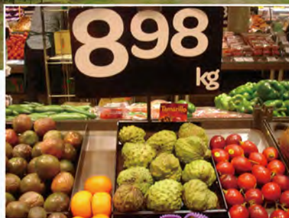
圖 7. 超級市場鳳梨釋迦販售情形，每公斤 8.98 澳幣。

筆者訪查布里斯本及陽光海岸的超級市場價格為每公斤 8.98 歐元（約折合新臺幣 251 元），在澳大利亞算是昂貴的水果（圖 7）。