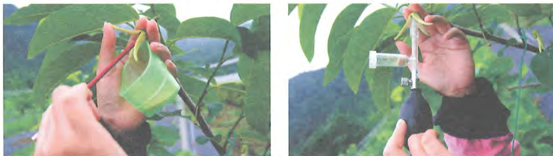
圖 2. 鳳梨釋迦以圭筆(左)及授粉器(右)進行人工授粉

番荔枝人工授粉之授粉工具、授粉時間、氣候條件、花粉品種及花粉活力等都會影響授粉成功率、畸形果率及果實品質等。目前鳳梨釋迦授粉以圭筆和授粉器操作(圖 2)，以授粉器每朵花授粉時間比圭筆快，且較省花粉 (25) 。