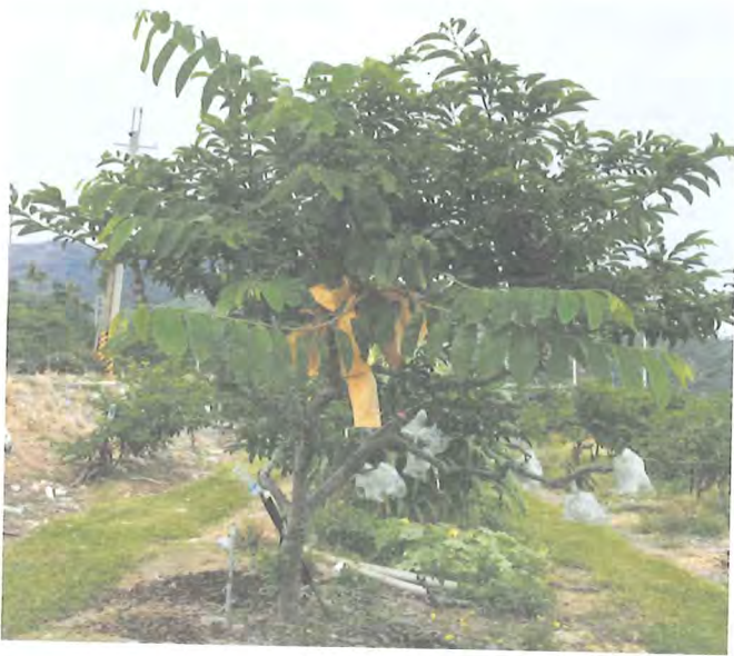
圖 3. 釋迦植株高接鳳梨釋迦枝條生產兩種果實