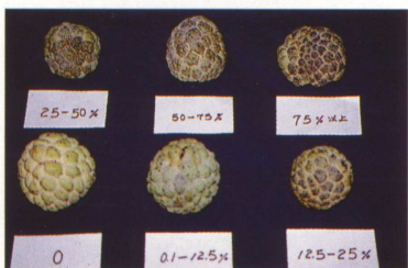
圖二、果實黑點病之不同罹病程度