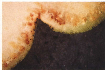
圖四、經解剖顯微鏡檢視，黑點發生於果皮下方