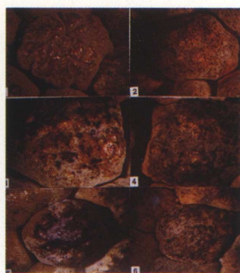
圖五、立體顯微鏡觀察果實黑點病之症狀，由輕至重