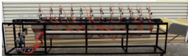
研發之鳳梨釋迦粉介殼蟲清除機械

以專利之四爪型果實承杯固定鳳梨釋迦，將果實輸送前進同時旋轉，旁邊配置36支不同角度的噴頭，進行吹除果實表面蟲體；高壓空氣由30馬力之空壓機提供，每小時使用22.5度電力，如以每度電5.28元計算，每小時空壓機電費約120元，機體上方以透明壓克力蓋包覆，防止蟲體飛散，機體下方以不銹鋼集蟲斗配合3臺集塵鼓風機將吹落的蟲體收集於網袋內，防止污染已經處理好的果實。操作時以人工將果實置於爪型承杯，果柄朝上即可自動進行蟲體吹除作業，再由人工取出並套上舒果網進行分級包裝。機械作業效率每分鐘可處理40個果實，平均清除成功率為89.7%，其中以若蟲成功率最低，主要為果實未經分級使噴頭與果實距離太遠及爪型承杯之死角所致，將持續改進作業模式以提升清除成功率。