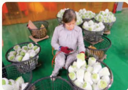
集貨場傳統鳳梨釋迦吹除粉介殼蟲情形

鳳梨釋迦為目前臺灣外銷之大宗水果，每年出口約10,000公噸，出口產值超過7億元，且仍持續成長。其中粉介殼蟲為出口檢疫之重點，為解決鳳梨釋迦果實帶有粉介殼蟲問題，除了加強田間防治外，目前主要作法為採收後於集貨場分級包裝時，使用高壓空氣吹走粉介殼蟲，但此方法在開放空間作業，易造成蟲體飛散，污染其他已處理之果實，造成仍有檢出粉介殼蟲的疑慮。因此本場積極研製鳳梨釋迦粉介殼蟲清除機械，以生產線概念，將鳳梨釋迦果實置於輸送帶上，逐一吹除粉介殼蟲，再由集塵鼓風機將吹落的蟲體收集，避免污染已經處理好的果實，降低出口鳳梨釋迦蟲體檢疫問題。